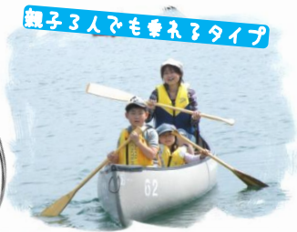
親子3人でも乗れるタイプ