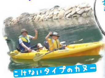
こけないタイプのカヌー

日程：①...4/27(土) ②...5/12(日) ③...6/9(日) ④...7/6(土) ⑤...7/20(土) ⑥...8/24(土) ⑦...9/7(土) ⑧...10/6(日)